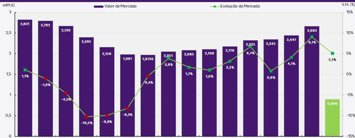
Gráfico 1 - Evolução do mercado farmacêutico de ambulatório em valor (mM€, PVF)